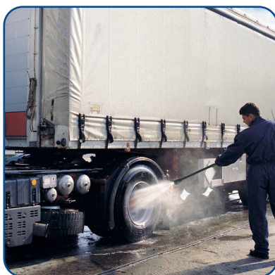
Potente, pratica e versatile grazie all'ampio kit accessori optional