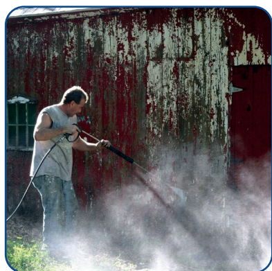
Ideale per operazioni di lavaggio e sgrassaggio difficili