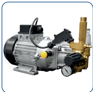
Motopompa con testata in ottone e pistoni in acciaio