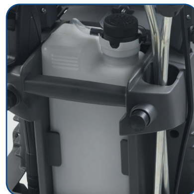
Serbatoio detergente estraibile con livello visibile