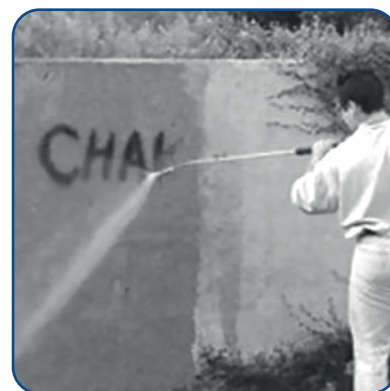
Ideale per operazioni di pulizia prolungate che necessitano alta pressione